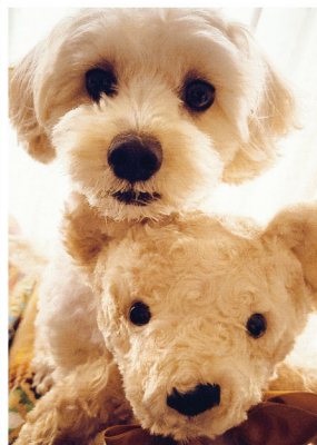
名前:ニコ 年齢:8歳 性別:オス (マルプー)