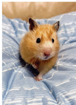
名前:きなこ 年齢:1歳7カ月 性別:メス (ゴールデンハムスター)